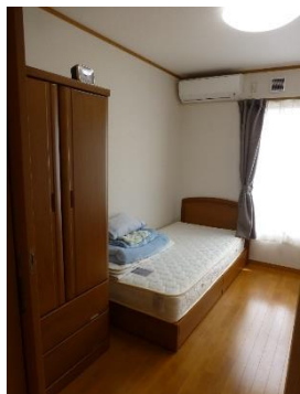
居室 自由な時間を