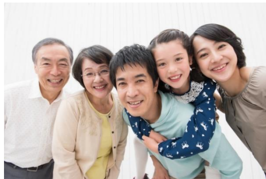
ご家族や地域との連携も