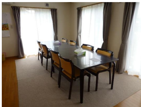
リビング 食事や歓談に